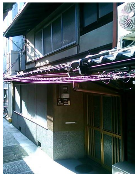
今回耐震改修した京町家

この度、まちの匠事業のメニューの中でも利用の多い屋根や柱、基礎の改修を行った京町家において、関係者の御協力の下、完成見学会を開催しますので、お知らせします。